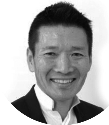
白鳥歯科インプラントセンター