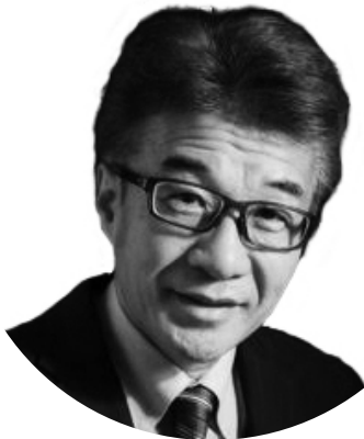
土屋歯科クリニック& works

注意事項：駐車場内における車両事故、人身事故及び車両物品の盗難並びに車内の遺留品の事故については、当院は一切責任を負いませんのでご了承ください。