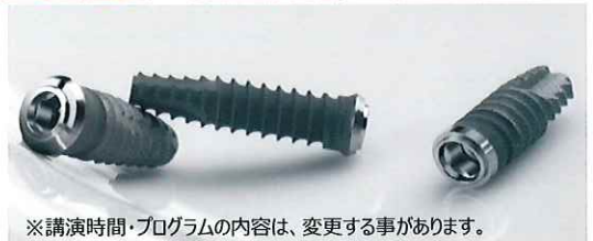
※講演時間・プログラムの内容は、変更する事があります。